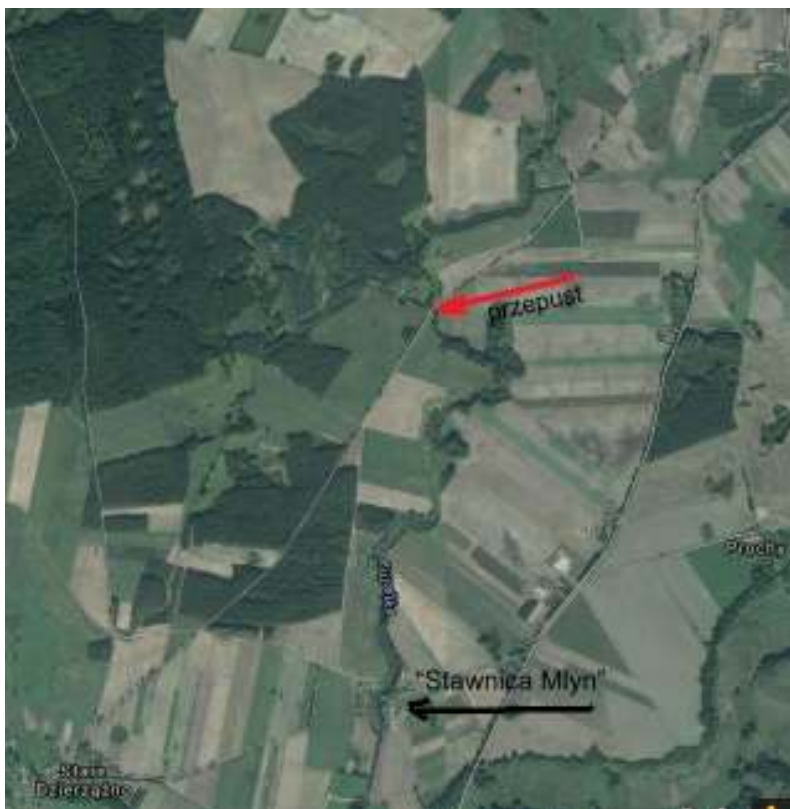
Załącznik 1. Mapka